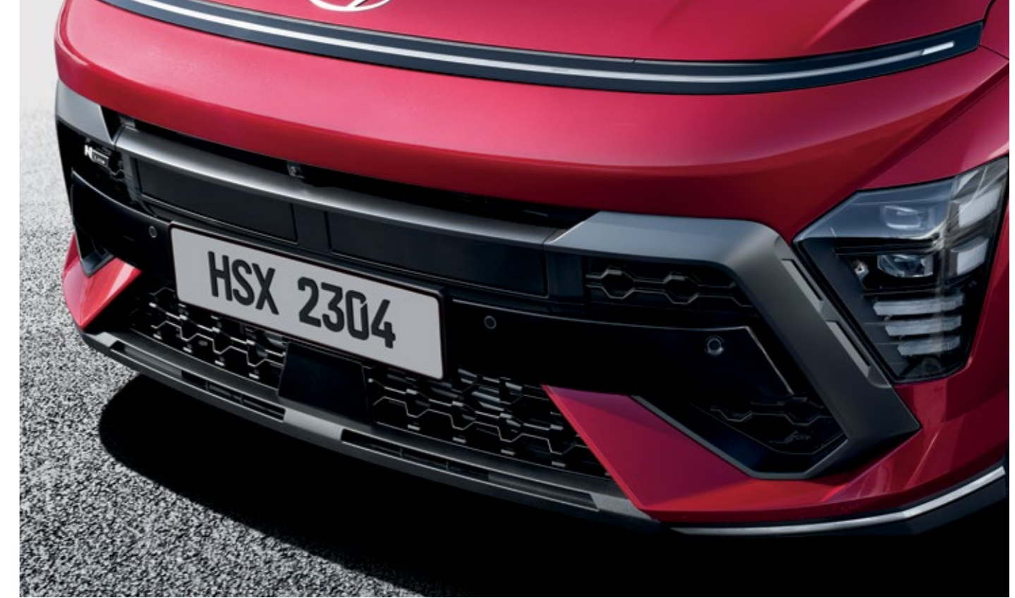
المصد الأمامي وحواف حماية المصد الحصرية من N Line