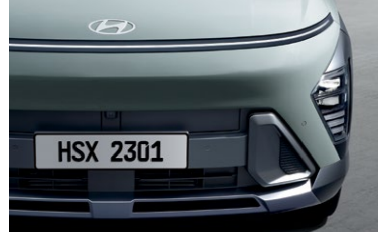
مصباح أمامي أفقي بدون وصلات، مصد أمامي