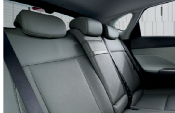
مزلاج يظهر مقاعد الصف الثاني يعمل بخطوتين