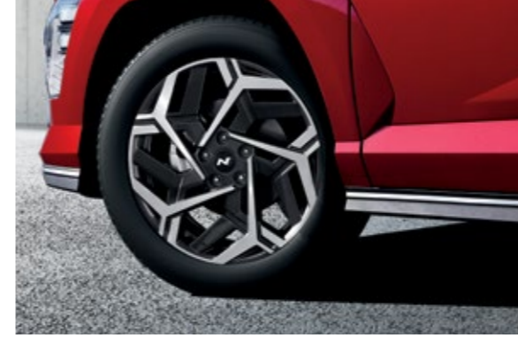
عجلات ألمنيوم مقاس 18 بوصة الحصرية من N Line / كسوة بلون الهيكل