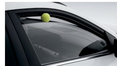
نافذة أمان كهربائية