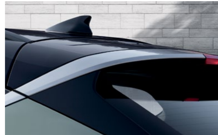
سقف بلونين، خط رابط حاد من الكروم