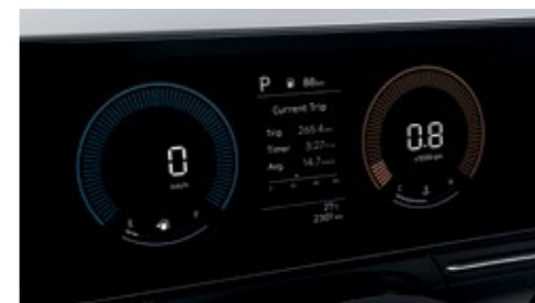
شاشة عدادات (شاشة LCD ملونة مقاس 4 بوصة)