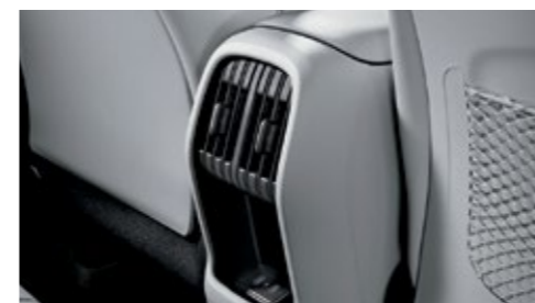
فتحة تهوية خلفية