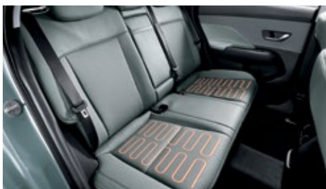
مقاعد خلفية مع تدفئة