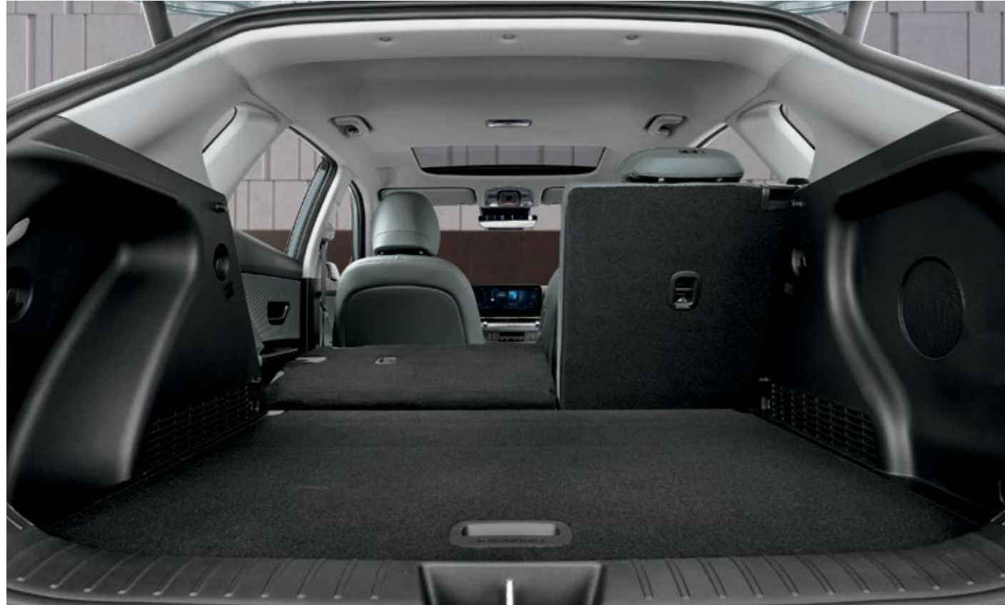
ظهر مقاعد الصف الثاني قابل للطي بنسبة 4 : 6

تتميز مقصورة كونا الداخلية بالعمليّة والانتساع، مع التركيز على راحة الركاب في الخلف وعلى حجم صندوق الأمتعة الواسع لتلبية أنماط الحياة المختلفة.