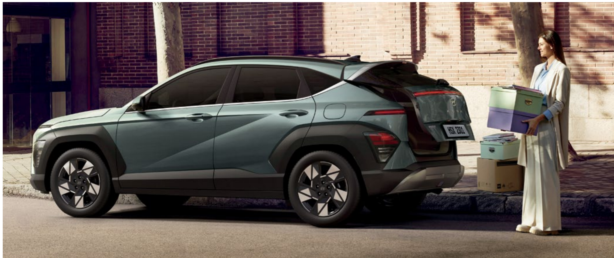
باب خلفي ذكي يعمل بالكهرباء - باب خلفي ذكي يعمل بدون استخدام اليدين مع قابلية الفتح التلقائي وضبط الارتفاع

تجتمع شاشة العرض بانورامية المزودة المدمجة بمقاس 12.3 بوصة مع تقنية مساعدة السائق المتطورة لتوفر راحة عالية التقنية وتزيد من رضا المستخدم عند الاستخدام اليومي.