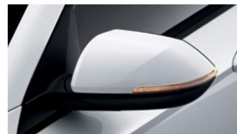
مرآة خارجية (مع تدفئة / قابلة للطي / مؤشر العطاف LED)