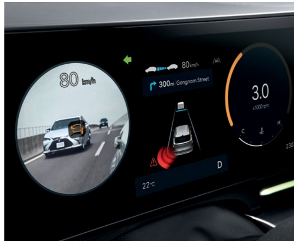
شاشة رؤية المنطقة العمياء (BVM)

تعرض شاشة الرؤية المحيطة (SVM) صوراً لمحيط السيارة من منظورات مختلفة لضمان الركن الآمن.