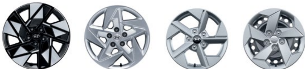
عجلات ألومنيوم مقاس 18 بوصة