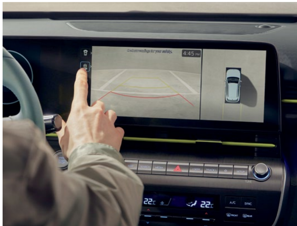
شاشة الرؤية المحيطة (SVM)

تعرض شاشة الرؤية المحيطة (SVM) صوراً لمحيط السيارة من منظورات مختلفة لضمان الركن الآمن.