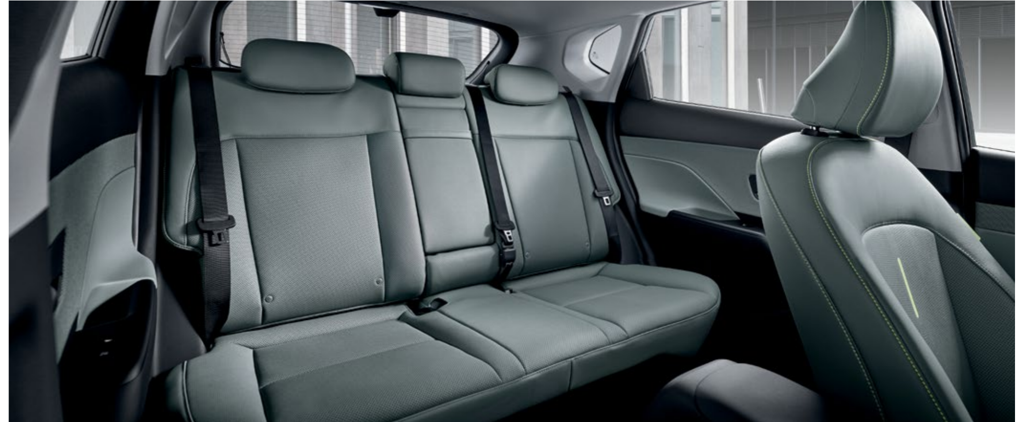
المتسع في صف المقاعد الثاني