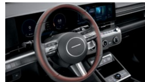
عجلة قيادة مع تدفئة