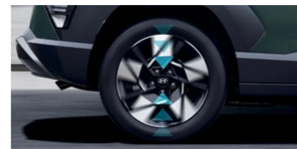
التقليل المحسّن من ضوضاء الطريق

اختر من بين مجموعة من أنماط القيادة وفقاً لتفضيلاتك أو ظروف الطريق، حيث تم تحسين المحرك والمكابح لتحقيق أعلى أداء للقيادة بما يتوافق مع النمط المختار وظروف الطريق.