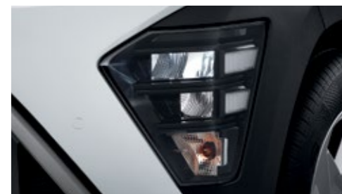
مصابيح أمامية LED (MFR)