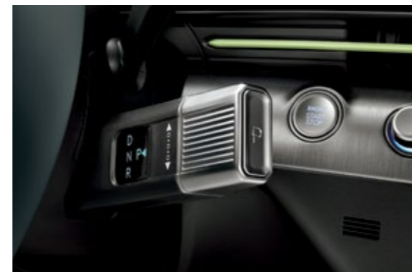
ناقل حركة إلكتروني من نوع العمود (SBW)