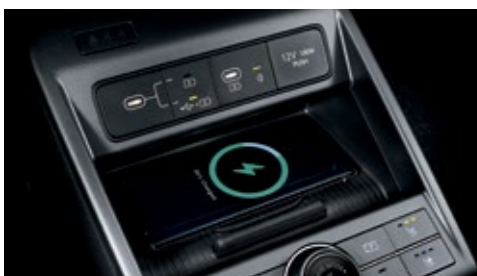
بيانات USB-C / منافذ للشحن / لوحة شحن لاسلكي