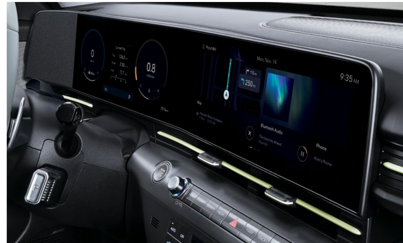
عرض بانورامي - شاشة مزدوجة مدمجة بمقاس 12.3 بوصة