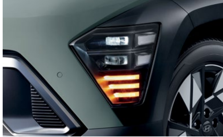
مصابيح أمامية LED بالكامل (نوع الإسقاط الضوئي)

تمتاز كونا بمقدمة بارزة مصقولة تبرز حجمها الخالص وتعزز من أدائها الديناميكي الهوائي، مع خط ديناميكي مميز يضيف تبايناً إلى سطحها البارامتري.