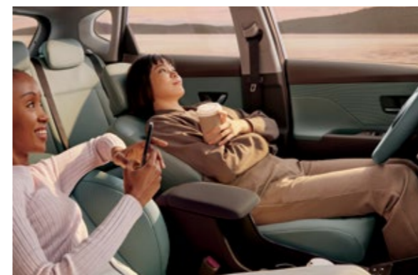
مقعد استرخاء مريح في الصف الأول