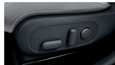
ضبط كهربائي لمقعد السائق