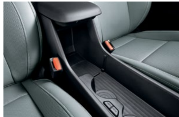
صندوق تخزين مفتوح في الكونسول (حاجز قابل للإزالة/ حوامل أكواب دوّارة)