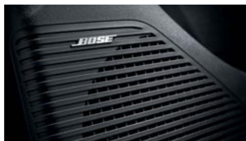
نظام Bose الصوتي الفاخر