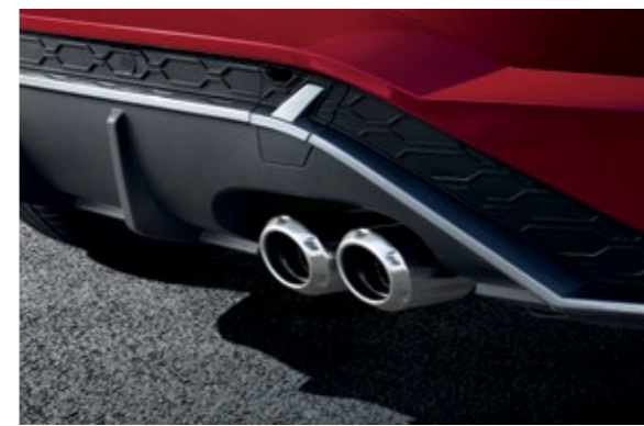
عدم مزدوج الطرف حصري من N Line