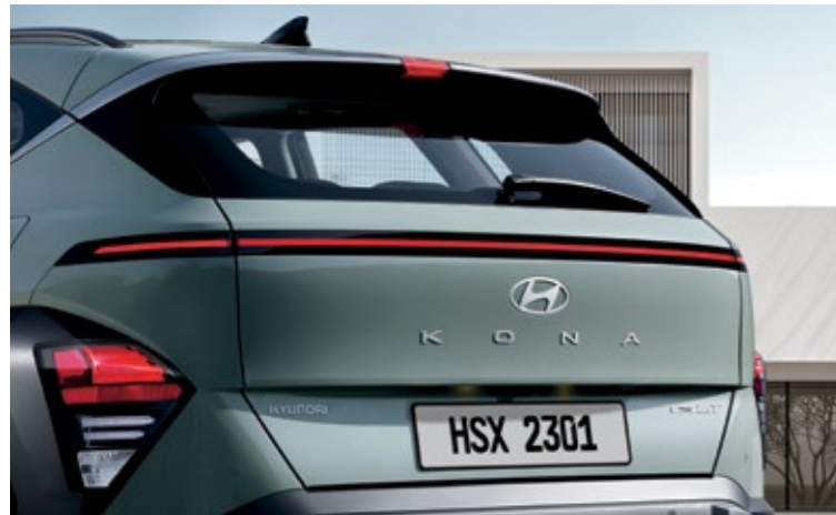
مصباح توقف عالي التثبيت مدمج بالجنح الخلفي، مصباح خلفي أفقي من دون وصلات مصابيح مكابح LED، مصابيح إشارة الانعطاف LED