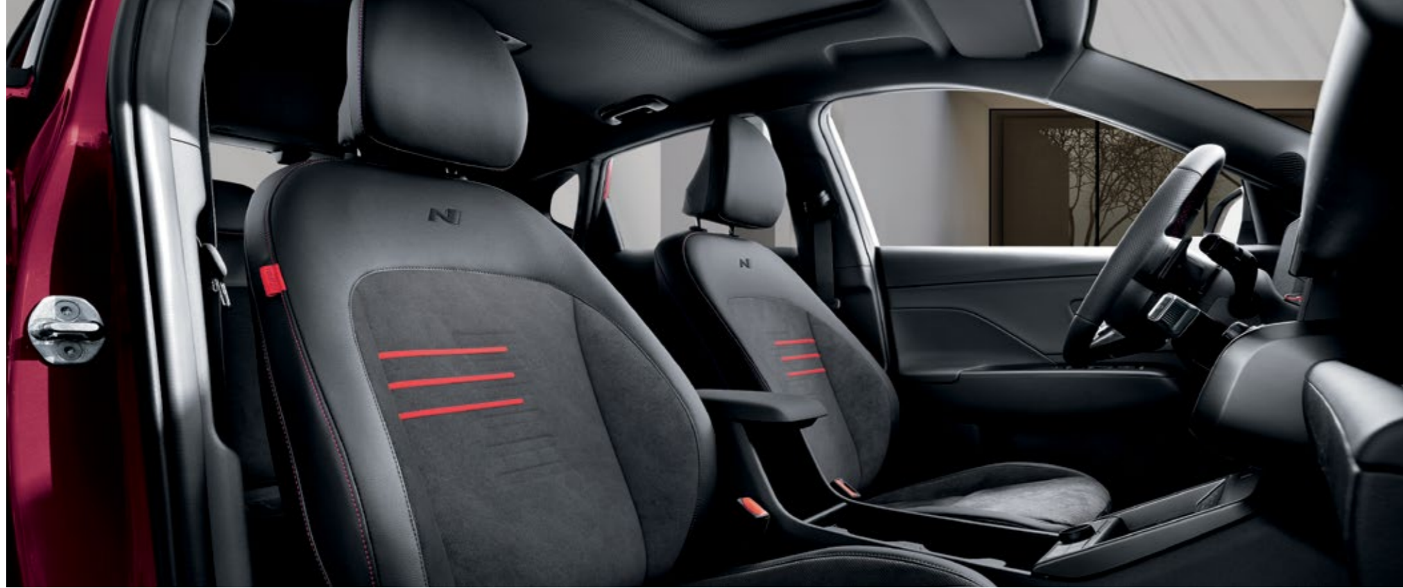
مقاعد من الجلد الأصلي/ جلد الكانتارا الحصرية من N Line

يزخر نمط N Line بالجرأة والديناميكية، ويتميز بتصميم خارجي عالي الأداء مستوحى من أداء N المتفوق والمعروف.