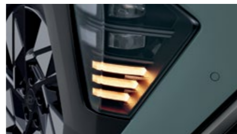
مؤشرات العطاف LED (أمامية/ خلفية)