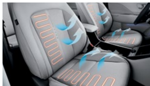
مقاعد أمامية مع تدفئة وتهوية