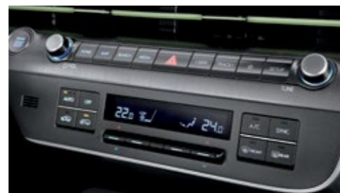
نظام تكييف هواء أوتوماتيكي بالكامل